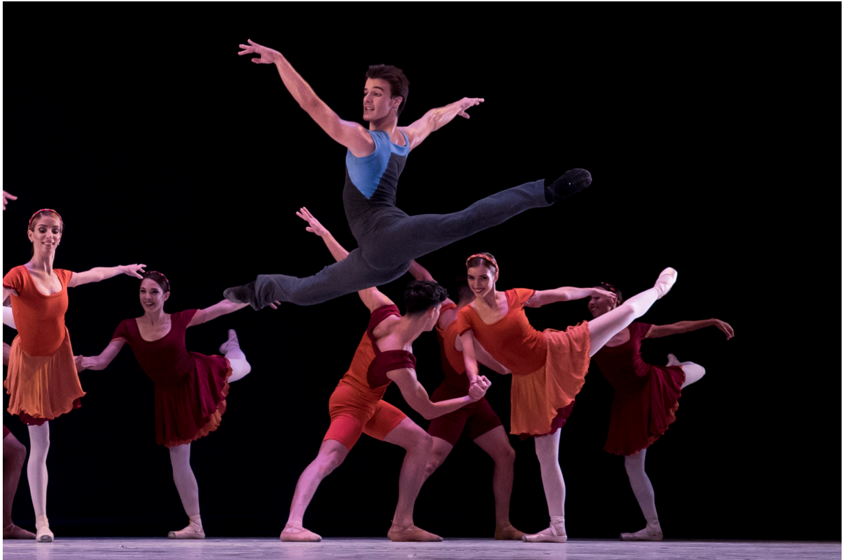
Concerto DSCH

El rigor artístico y técnico de sus bailarines y la amplitud y diversidad en la concepción estética de los coreógrafos, otorgan al Ballet Nacional de Cuba un lugar relevante entre las grandes instituciones de su género en la escena internacional.